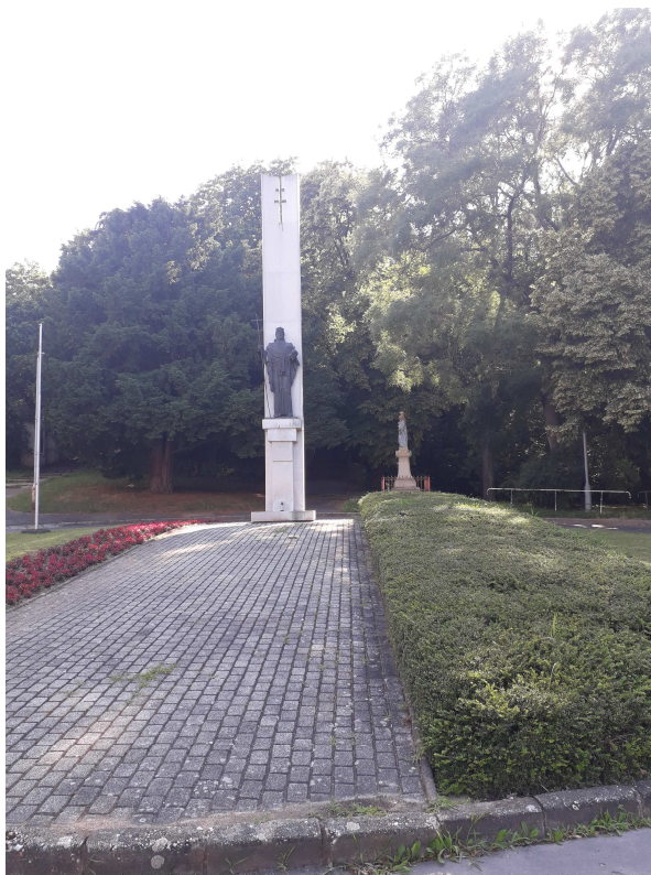
Szent István szobor