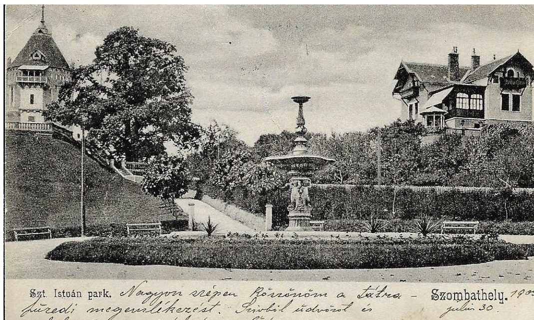
Szent István park 1905.