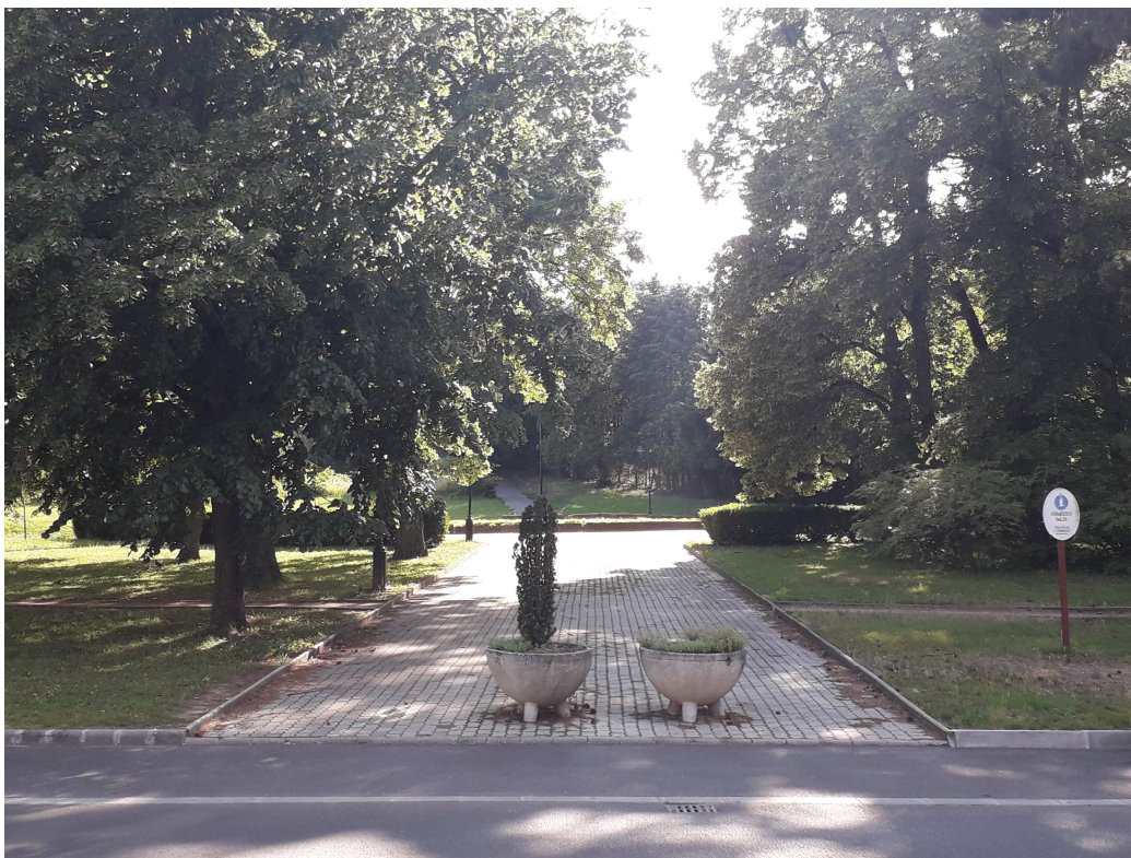
Helyi jelentőségű védett természeti terület

2. A 2012. évi XXX. törvény 1. § (1) bekezdés j) pontjának való megfelelést valószínűsítő dokumentumok, támogató és ajánló levelek