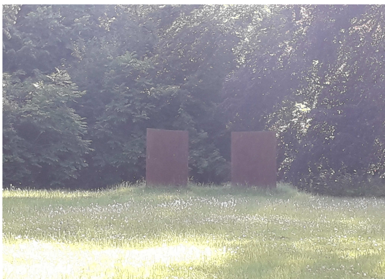
A két meghajlított vaslemez a római színházra emlékeztet.