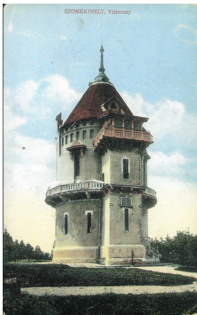
A régi víztorony (Kőszegfalviné Pajor Klára képeslapja)