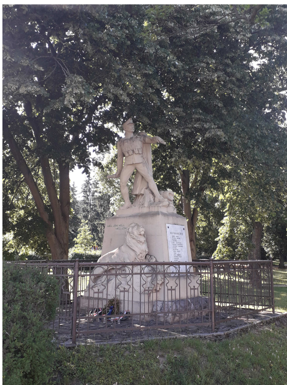
A 83-as gyalogezred elesett hőseinek állított emlékmű